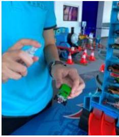
圖片 13 :

安排工作人員在訪客離開玩具試玩區後即時替玩具消毒，下一組訪客亦需以消毒搓手液再次清潔雙手後才接觸玩具。