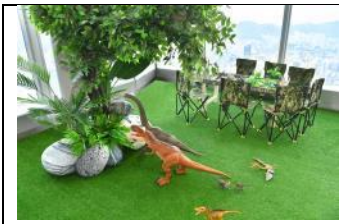
圖片 4 :