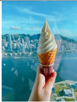
圖片 7 :

只需在 Café 100 by The Ritz-Carlton, Hong Kong (Café 100) 出示小童門票，即可以 85 折購買乳脂含量達 8% 的香滑北海道牛奶軟雪糕。