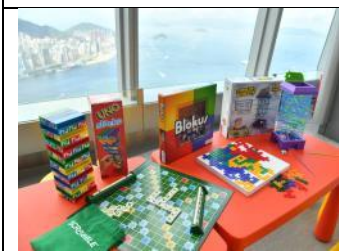
圖片 5 :