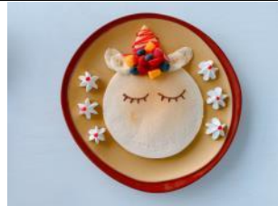
圖片 8 :

只需在 Café 100 by The Ritz-Carlton, Hong Kong (Café 100) 出示小童門票，即可以 85 折購買乳脂含量達 8% 的香滑北海道牛奶軟雪糕。