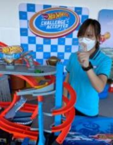
圖片 14 :